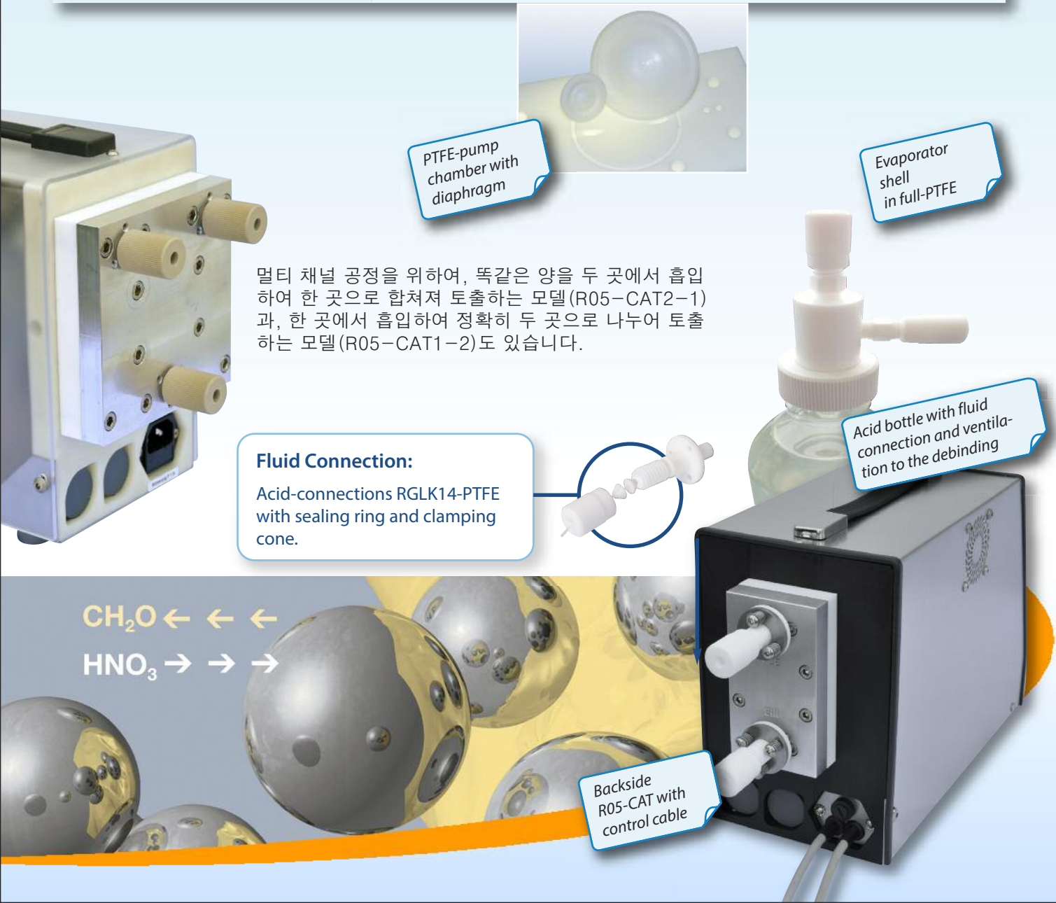
PTFE-pump chamber with diaphragm